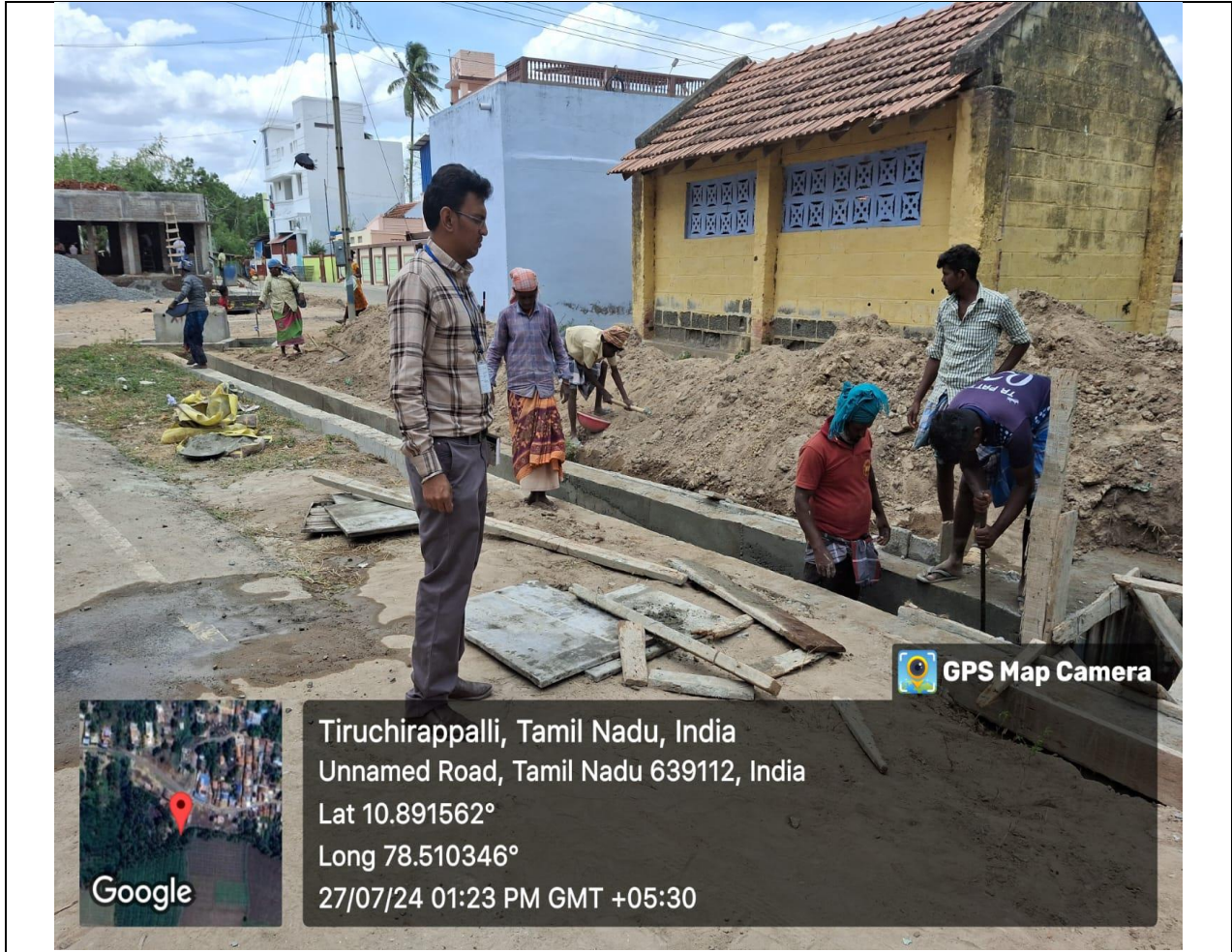
Construction of Drainage channel from Community Health complex in progress