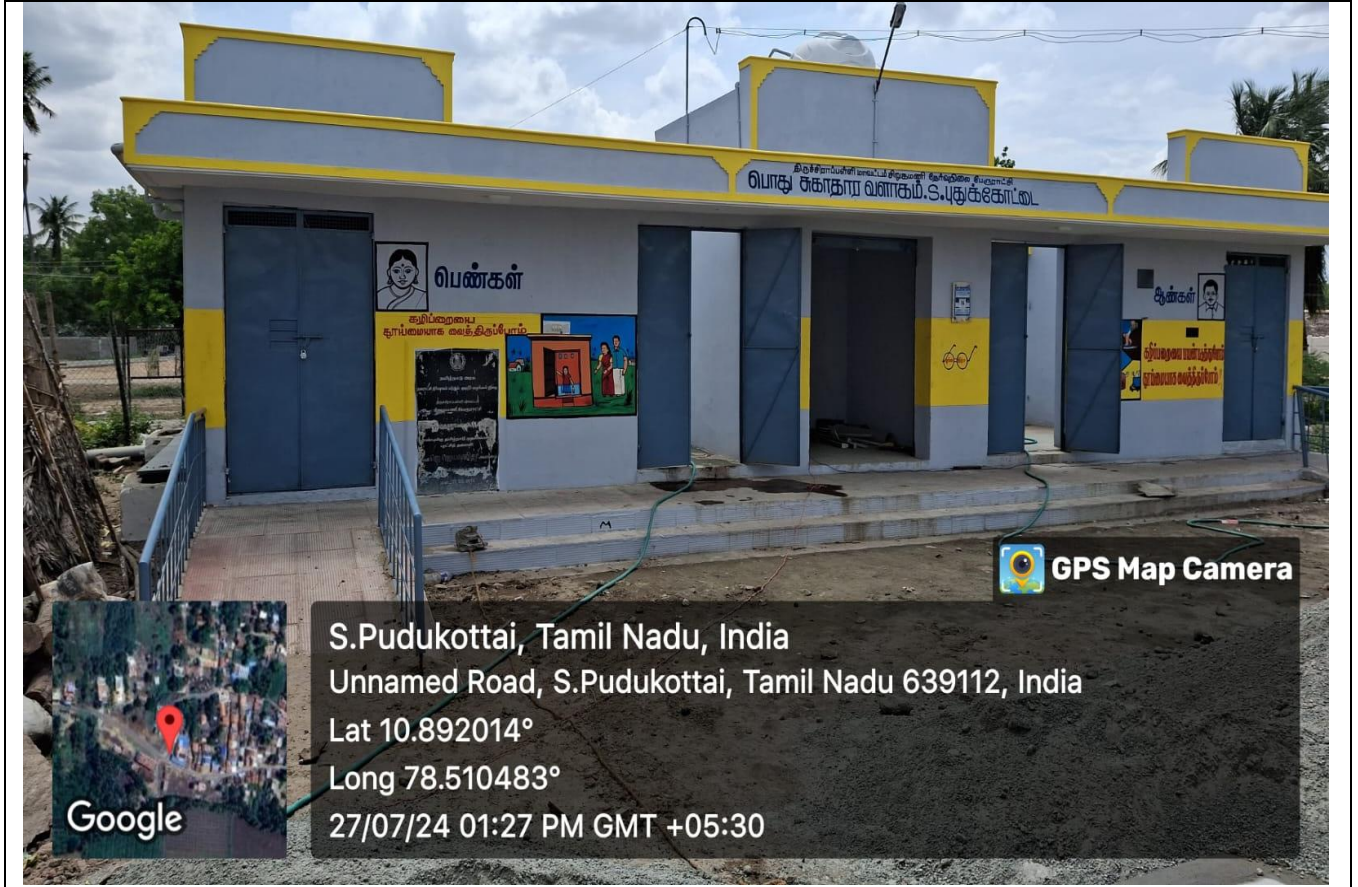
View of Community Health Complex, Sirugamani Town Panchayat