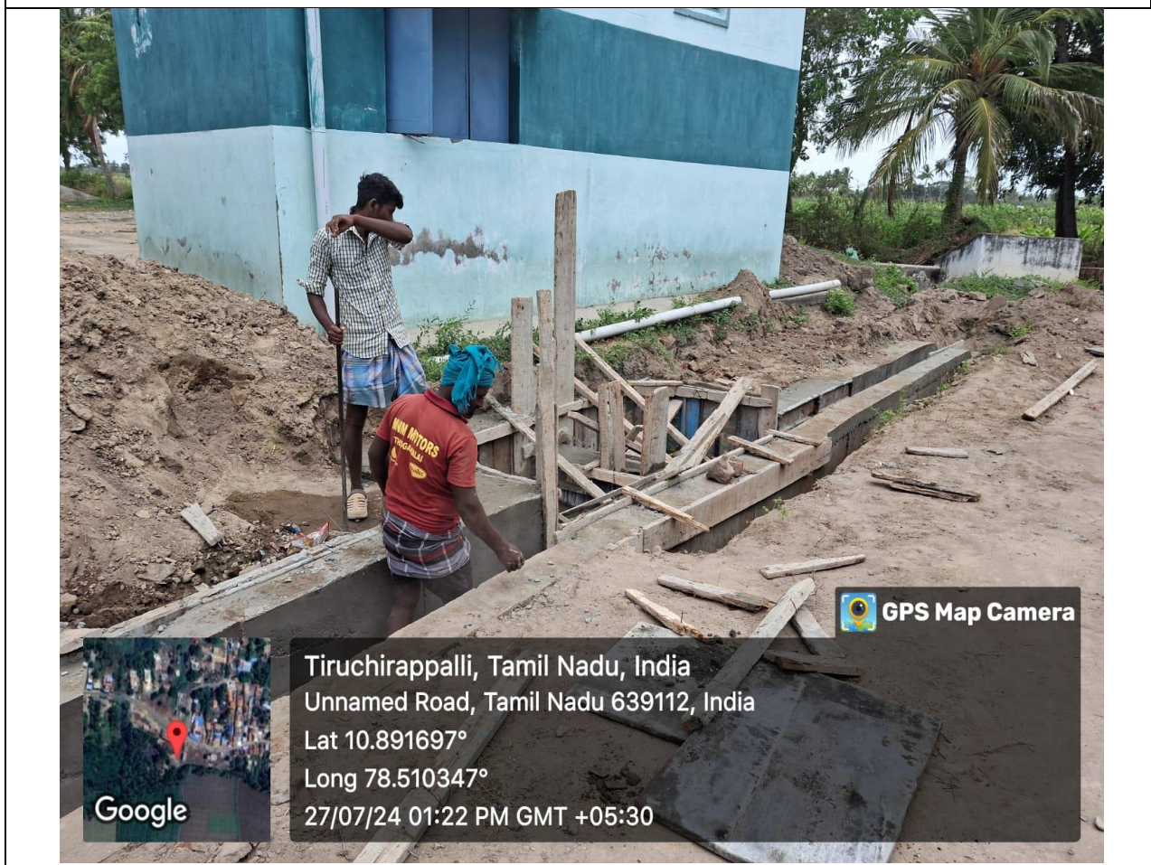
Construction of Filtration system in progress